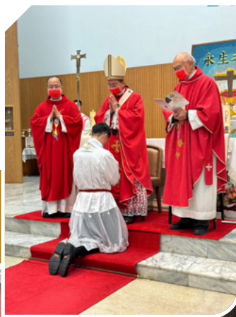
Diaconate Ordination, Taipei, Taiwan 領授執事聖秩 (25FEB2023)