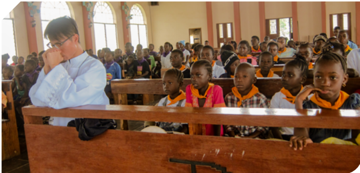
Renewal of Religious Vows, Lungi, Sierra Leone 復願 - 獅子山共和國 (16AUG2016)