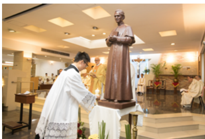
Perpetual Profession, Hong Kong 宣發終身聖願 - 香港 (16AUG2017)