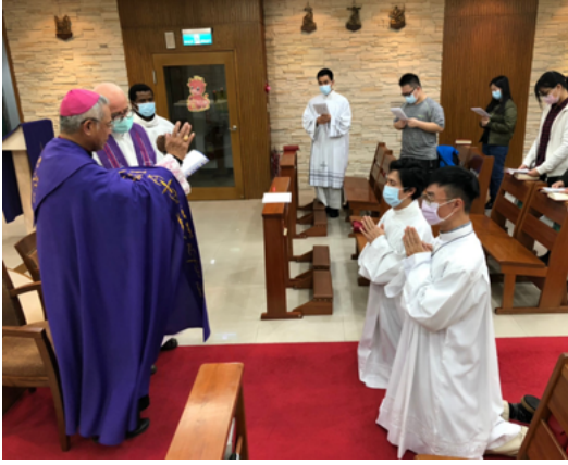
Institution of the ministry of Lector, Taipei, Taiwan 領授讀經職 - 台北 (17FEB2021)