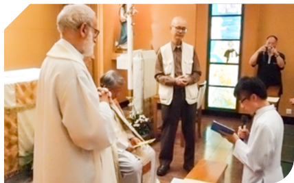
Renewal of Religious Vows, Hong Kong 復願 - 香港 (06MAY2012)