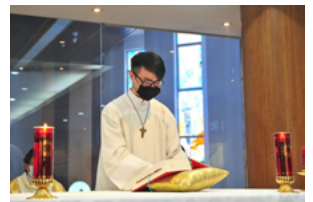
Institution of the ministry of Acolyte, Taipei, Taiwan 領授輔祭職 - 台北 (19MAR2022)