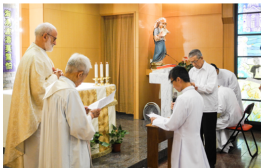
Renewal of Religious Vows, Hong Kong 復願 - 香港 (16AUG2013)