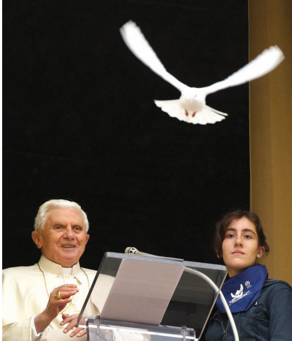
Une colombe en plein vol attire l'attention du pape Benoît XVI et d'une jeune croyante lors de l'Angélus du 31 janvier au Vatican. L'envolée a eu lieu à l'occasion de la journée mondiale de prière pour la paix au Moyen-Orient.

Le fossé entre la perception et la réalité démontre d'abord le pouvoir stagnant de