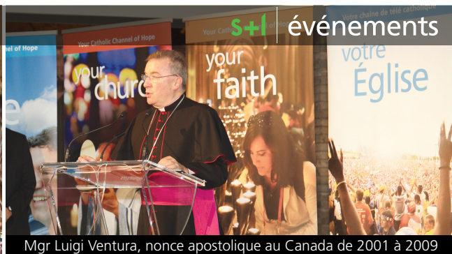
Mgr Luigi Ventura, nonce apostolique au Canada de 2001 à 2009

UNE SOIRÉE À LA MER MORTE Le 14 octobre dernier, à l'occasion d'une exposition historique sur les Manuscrits de la mer Morte et des Dix Commandements, des membres du milieu des affaires et communautaire en provenance de tout le pays se sont rassemblés pour célébrer et soutenir Télévision Sel + Lumière, la chaîne de télévision catholique nationale du Canada. L'événement a permis d'amasser 1,9 millions $ – un montant nécessaire afin d'assurer la continuité de la chaîne, et un projet qui attire des admirateurs à travers le monde.